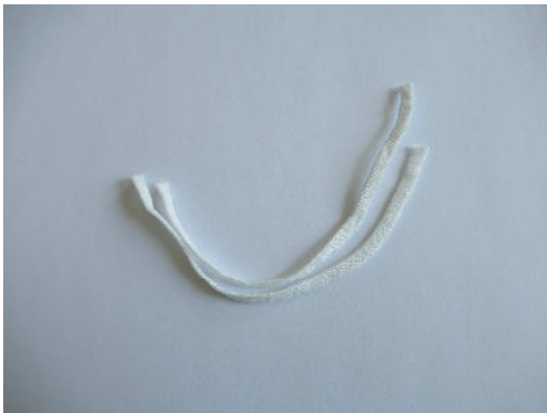
55268558003 Sentias FFP2 NR Maske - Gummiband