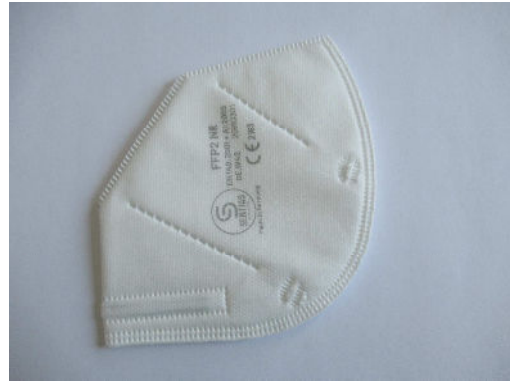
55268558002 Sentias FFP2 NR Maske - Fleece