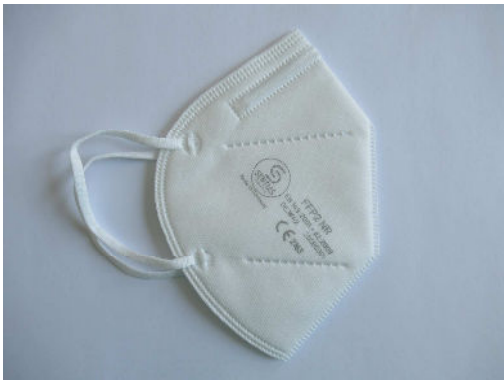
55268558005 Sentias FFP2 NR Maske